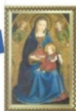
La Virgen de la granada C/ Alarcón Museo Nacional del Prado, Madrid.